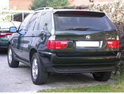
Vista de más cerca: