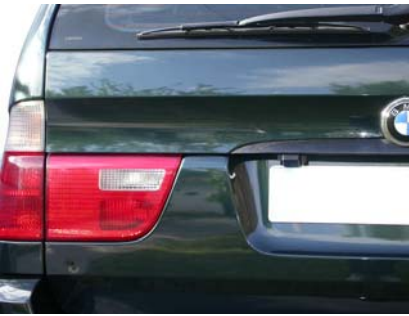
y más (se nota que es primavera, por las motitas de polen