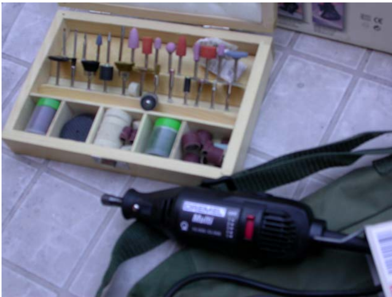
Destornilladores, utilería en general, llaves de tubo